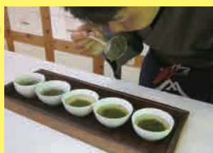
「美味しい」の、ひと言を喜びとする 五代目当主の心意気